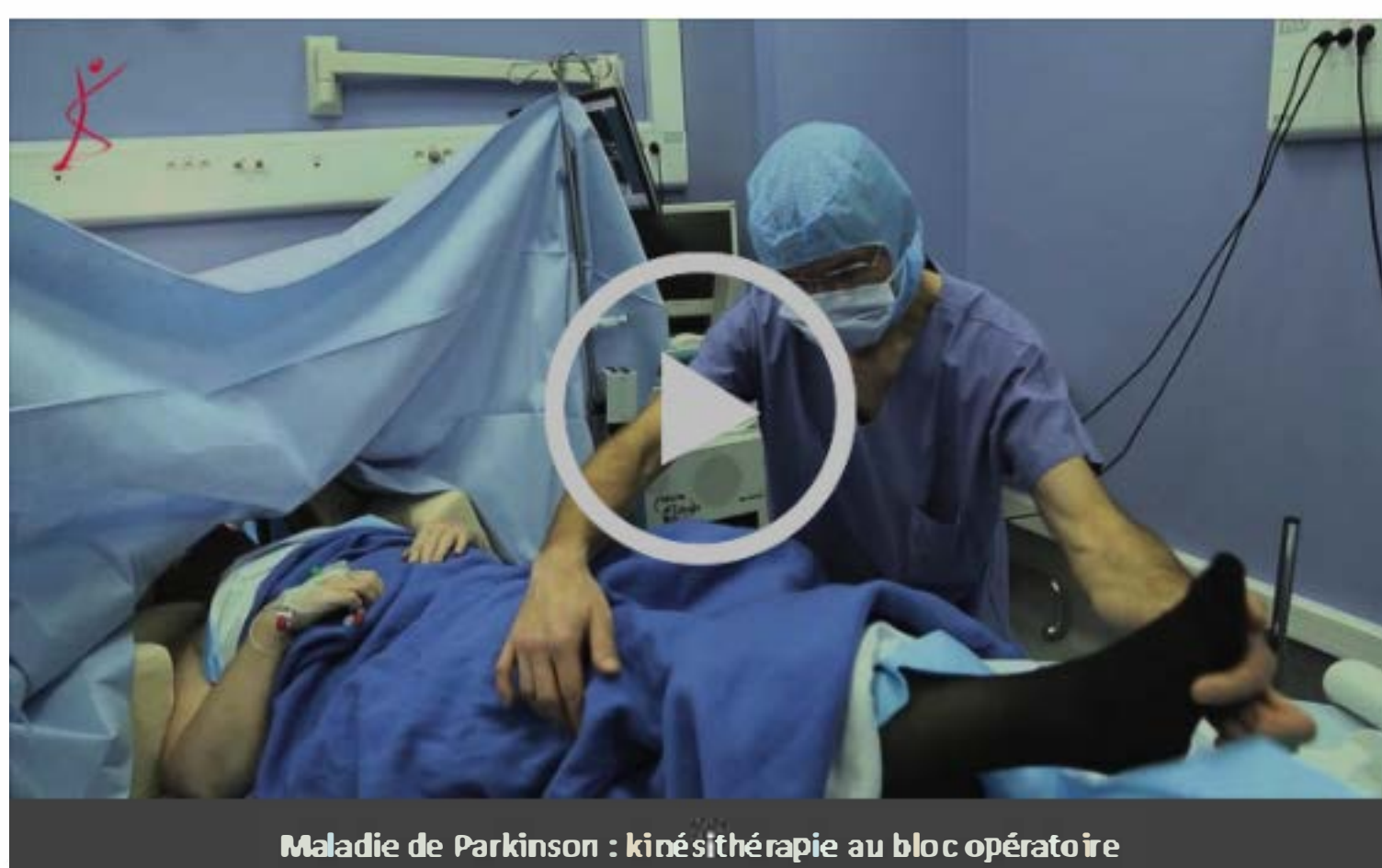
Maladie de Parkinson : kinésithérapie au bloc opératoire